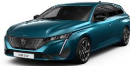
Coppery kék széria - 5W