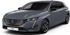
Selenium szürke opció