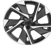
17" "Halong" alumínium Allure, Active PHEV, Allure PHEV széria