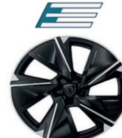
18" "Electra" alumínium Allure BEV, GT BEV