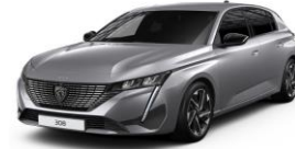
Artense szürke opció