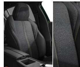
ISABELLA+BELOMKA bőr/szövet cárpit GT széria