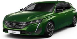
Olivine zöldség széria - 5 ajtós