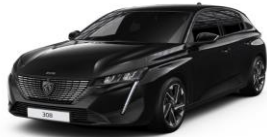
Perla Nera fekete opció