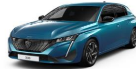
Obsession kék opció - 5 ajtós