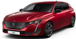
Elixir piros opció