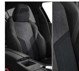
Alcantara cárpit GT opció / GT BEV széria