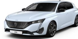
Okénite fehér opció