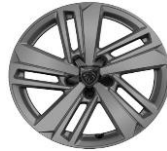
16" "Auckland" alumínium Active széria