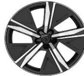
18" "Kamakura" alumínium GT, GT PHEV széria