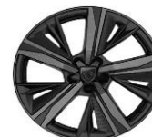
18" "Portland" alumínium GT opció